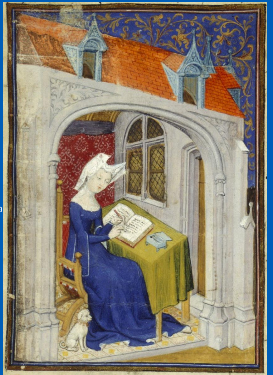
Christine de Pizan nel suo studio, ms. Harley 4431, f. 4r (1414), Londra, British Library

Professore a contratto in Storia del pensiero politico e in Storia delle donne nel pensiero politico - Università di Parma